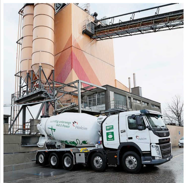
Der neue elektrische Betonmischer der Holcim kam sofort auf der anliegenden Baustelle zum Einsatz.