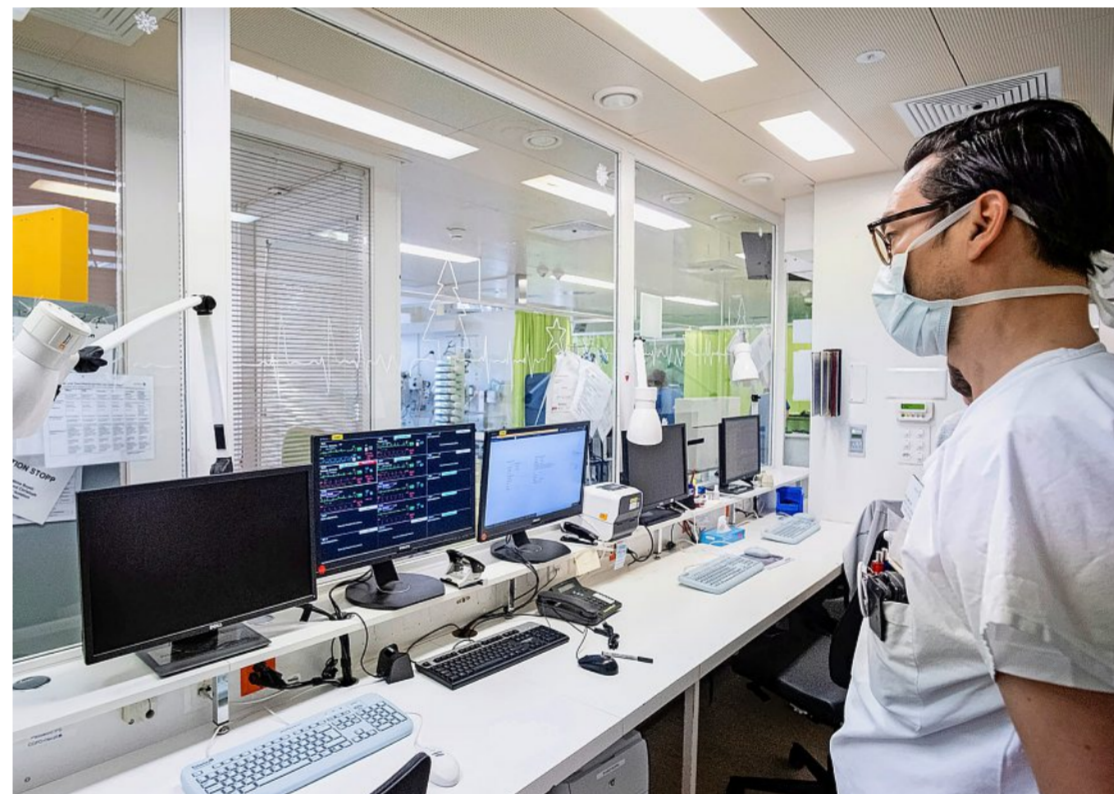
Die turbulenten Vorgänge im Spital Bülach haben den Chronisten stark beschäftigt.

durch in einem Gespräch etwas erfahre, mache ich mir umgehend Notizen.»