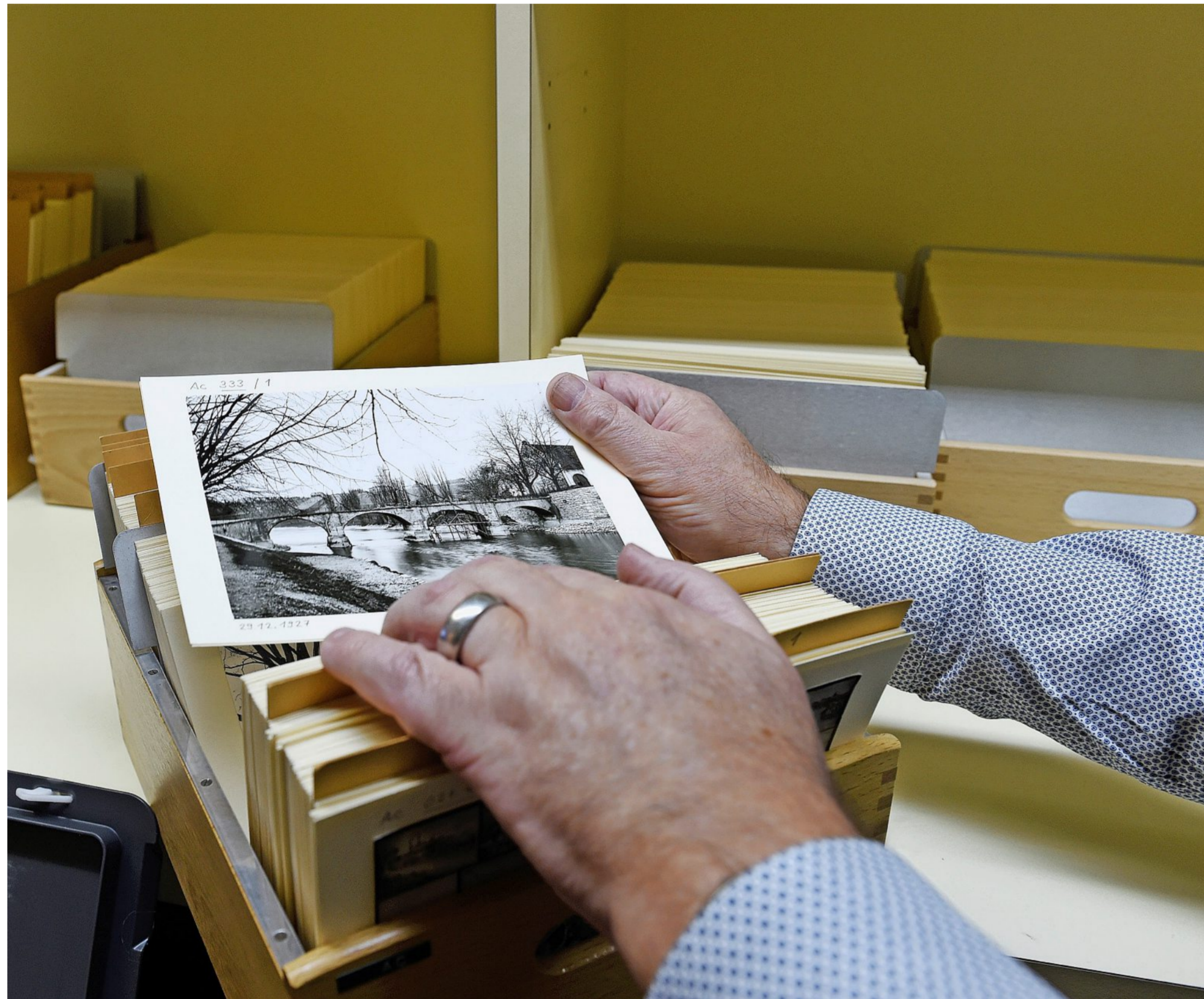
Auch im turbulenten Jahr 2020 hatten die Dorfchronisten einiges zu tun.

Der seit 1998 tätige Eglisauer Chronist bemüht sich auch um alte Dokumente und ruft deshalb einmal mehr dazu auf, Kauf-, Gant- und Teilungsbrieft, Inventare, Familiengeschichten, Stammbäume und Vereinsprotokolle nicht wegzuerwerfen, son-