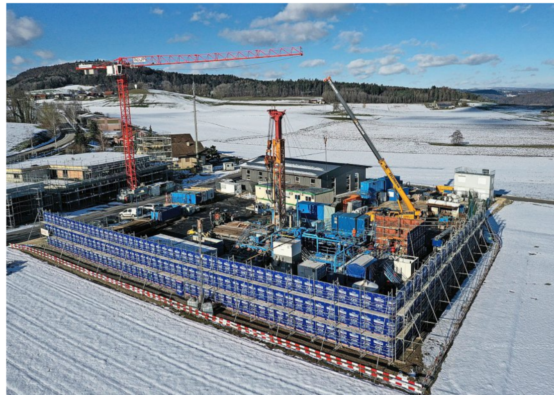
Auch Themen wie das Endlagers finden Eingang in die Dorfchroniken – hier der Bohrplatz in Stadel.